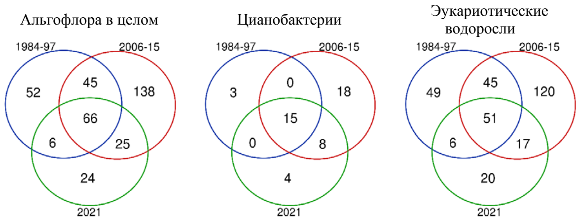
Рис. 1. Распределение общих и уникальных видов альгофлоры планктона в разные периоды исследования (диаграммы Венна).

Виды, для которых известно отношение к солености, составляют 71% от общего видового богатства альгофлоры р. Уса. Из них 84% приходится на водоросли-индифференты по отношению к этому показателю.