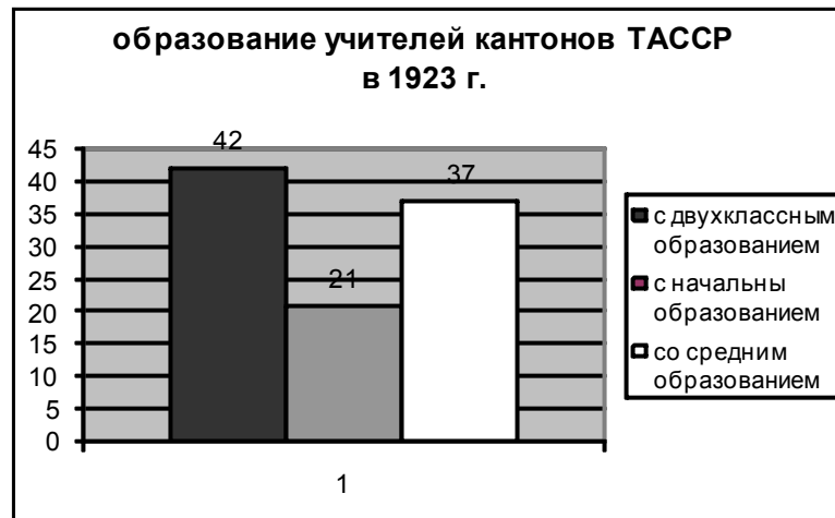
Диаграмма составлена по материалам НА РТ ф. Р-3682, оп.1, ед.хр.478, л. 8.

Кроме того, в докладе Наркомпроса ТАССР на VII Всетатарском съезде Советов "Народное образование в Татарии за 1925 – 1926 гг." говорилось о недостатке педагогических сил, низком культурном уровне просвещенцев, что заставило Наркомпрос ТАССР обратить особое внимание на переподготовку учительства. 1925 – 26 год может считаться первым годом плановой работы по переподготовке учительства. С этого времени берет начало курс на формирование учителя-общественника, проводяще-