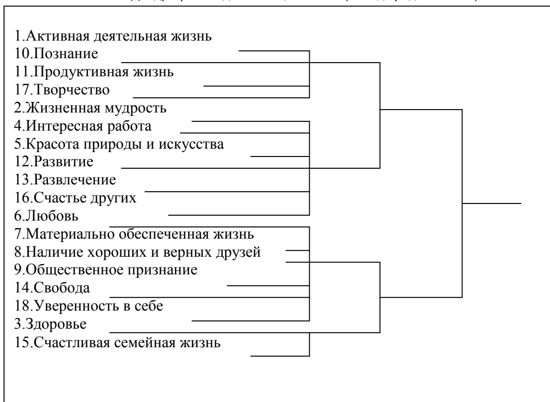
Рис. 1. Дендрограмма для 18 Т-ценностей (метод средней связи)

Далее, анализ особенностей И-ценностей в группах старших ПСОП и ПБОП (таблица 2) показал статистически значимое различие по t-критерию Стьюдента по ценности «терпимость», более высокую у ПСОП. Кроме того, при сопоставлении двух эмпирических распределений по \lambda -критерию Колмогорова – Смирнова обнаружено значимое статистическое различие ( \lambda_s = 1,38 , при p \leq 0,05 ) между двумя группами. Также, в группе подростков 15 – 17 лет с отклоняющимся поведением отмечается тенденция повышения значимости ценностей «жизнерадостность», «независимость», «рационализм», «твердая