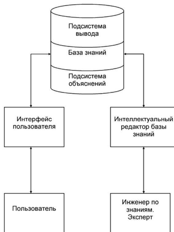
Рис. 2. Обобщенная структура экспертной системы

носитель в форме, понятной эксперту и пользователю. Подсистема вывода – программная компонента экспертных систем, реализующая процесс ее рассуждений на основе базы знаний и рабочего множества.