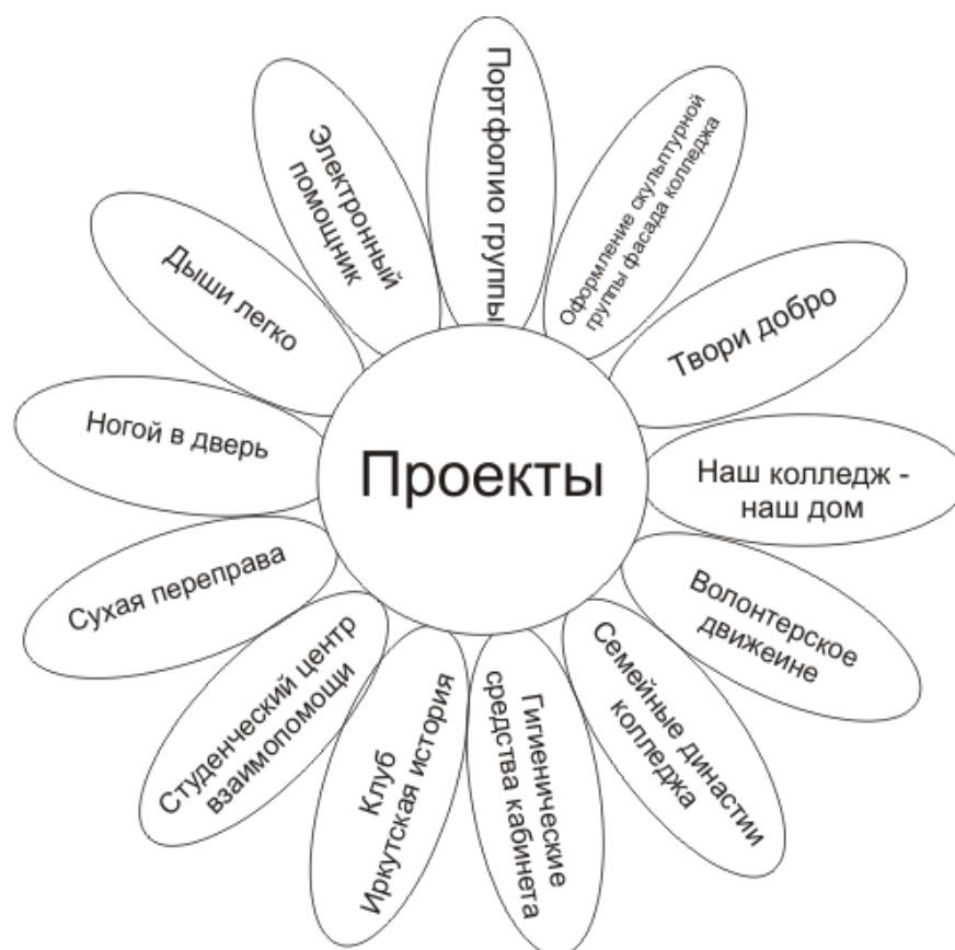
Рис.3. Конкурс проектов

Участвовали в конкурсе общественно-полезных проектов и программ органов городского самоуправления г. Иркутска; выиграли грант и восстановили совместно с родителями баскетбольную площадку на улице. В настоящее время продолжается реализация выше названных проектов. 4) «Никто ничего для нас не сделает, многое можно сделать своими руками». Системообразующей деятельностью в колледже является труд. Сами создали музей, сами ремонтируем, белим, красим. Клуб «Эдельвейс» – озеленил колледж, клуб «Золотая рыбка» – сделал аквариумы. 5) Организуя разнообразную, насыщенную трудом и эмоциями воспитательную деятельность, наши педагоги отчетливо понимают, что это лишь часть воспитательной системы – та часть, что рассчитана на всех. Но не все, что рассчитано на всю массу студентов, срабатывает в отношении каждого отдельного студента. А значит, обязательно нужна обратная связь – диагностика, коррекция. Диагностика реального уровня воспитанности не всегда возможна объективными методами, и мы используем разные методы социологического объективного анализа на основе опроса студентов. 6) С целью духовного становления студентов активно включаем в учебно-воспитательный процесс культурные и субкультурные компоненты. Этому способствует многообразие форм взаимодействия с учреждениями социально-культурной сферы города (вы-