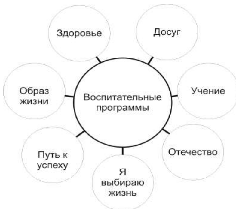
Рис.1. Воспитательные программы