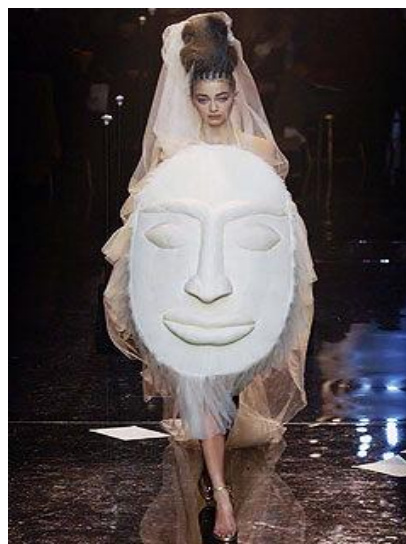
Рис. 2. Свадебный ансамбль Жана-Поля Готье, 2005 г.

Оно представляет собой связанный вручную кокон (рис. 1), который открывает лишь лицо невесты. Это платье символизировало положение женщины в браке, которое еще в середине XX века было весьма незавидным 2 .