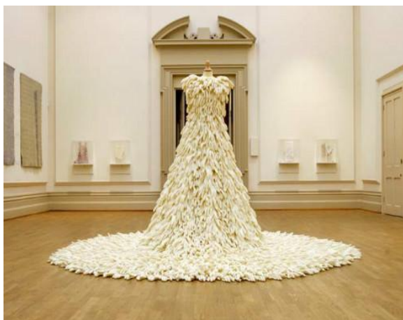
Рис. 5. Свадебный ансамбль Сюзи Мак Мюррей