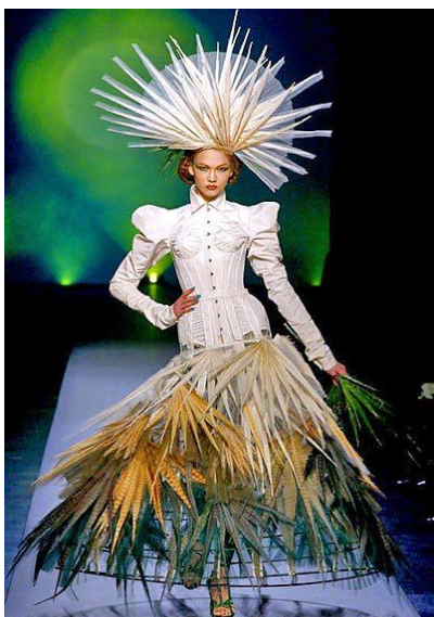
Рис. 3. Свадебный ансамбль Жана-Поля Готье, 2010 г.