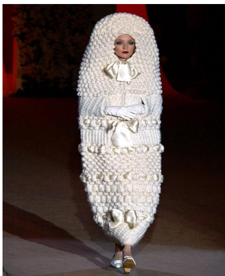
Рис. 1. Свадебный ансамбль Ив Сен-Лорана, 1965 г.