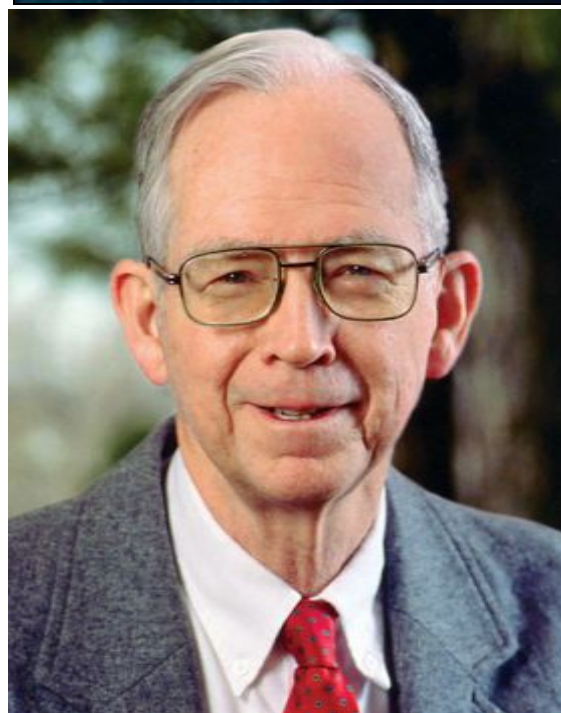
Холмс Ролстон (Holmes Rolston, III; г. р. 1932)

Новая книга Ролстона представляет собой, скорее всего, монографически оформленный курс лек-