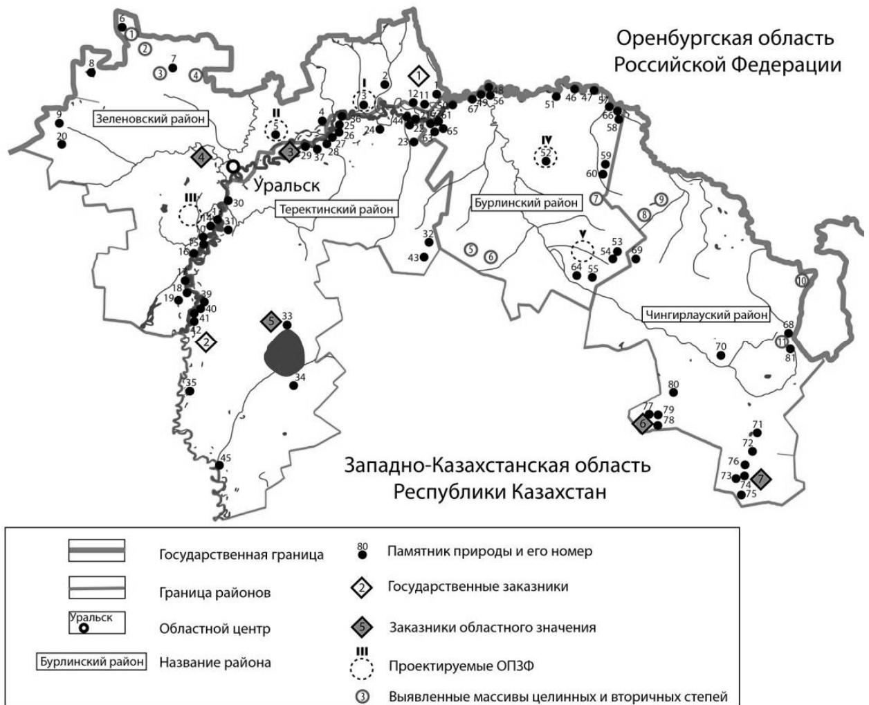
Рисунок 4. Карта-схема расположения объектов ПЗФ в приграничных районах Западно-Казахстанской области

Регионы трансграничной социально-экономической геосистемы бассейна реки Урал должны стать субъектами устойчивого развития в условиях международной интеграции. В рамках стратегии устойчивого развития и организации новых форм трансграничных особо охраняемых природных территорий, на 2011-2014 гг. предусмотрены к реализации проекты ПРООН/ГЭФ/Минприроды России «Совершенствование системы и механизмов управления ООПТ в степном биоме России» и ПРООН/ГЭФ/Правительства Республики Казахстан «Сохранение и устойчивое управление степными экосистемами». В рамках указанных проектов предусмотрено проведение эколого-экономического обоснования и подготовка предпроектной документации по организации трансграничных ООПТ на границе Оренбургской области РФ и Республики Казахстан.