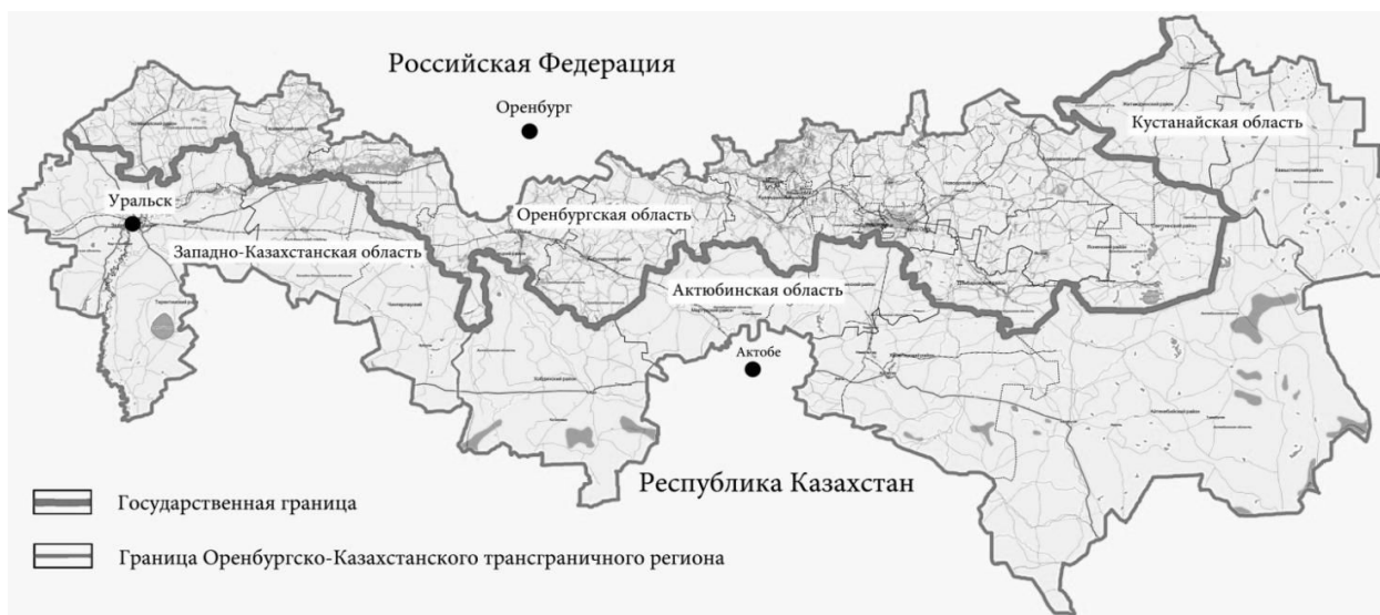
Рисунок 2. Карта-схема границ Оренбургско-Западно-Казахстанского трансграничного региона.