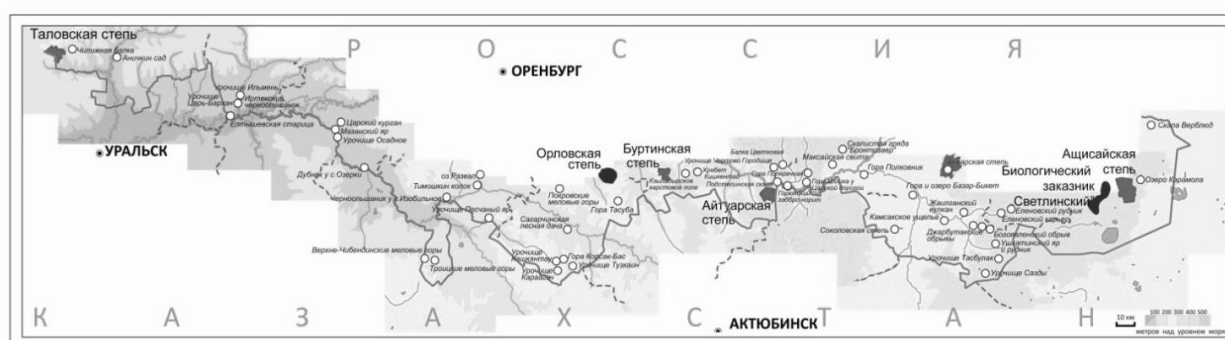
Рисунок 3. Карта-схема расположения приграничных объектов ПЗФ Оренбургской области.

Природные парки способны внести вклад в развитие рентабельного охотничьего хозяйства и организацию спортивного и любительского рыболовства. Необходимо иметь в виду, что деятельность ОПТ содействует привлечению в регион дополнительных инвестиций, в том числе иностранных.