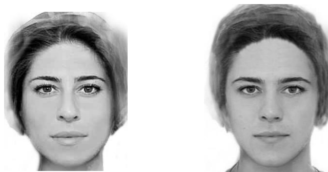
Рис. 1. Пример изображений, использованных в исследовании. Слева – фотография женщины (высокая феминность), справа – изображение, полученное в результате морфинга (низкая феминность)