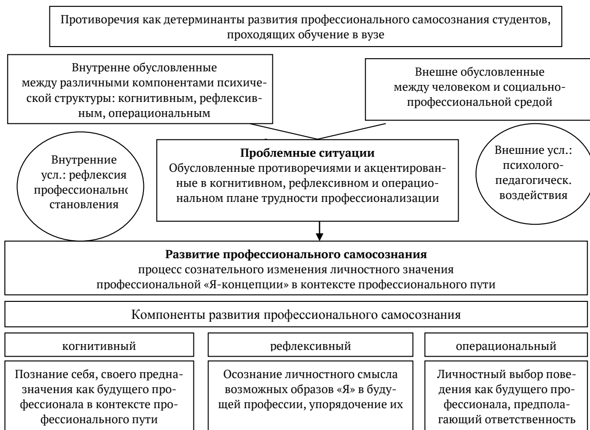
Рис. 1.2. Детерминанты развития профессионального самосознания студентов вузов

В развитии профессионального самосознания можно выделить три психологических аспекта: когнитивный, рефлексивный и операциональный. Когнитивный аспект отражает способность познания себя как профессионала, своего профессионального предназначения в контексте профессионального пути. Рефлексивный аспект выражает способность к осознанию личностного смысла возможных образов «Я», прогнозированию изменения ситуации и поведения других субъектов профессиональной деятельности в зависимости от собственных действий, связанных с осуществлением целей и задач профессионального развития. Операциональный аспект отражает способность осуществлять личностный выбор профессионального поведения и понимать совокупность ожиданий их проявления.