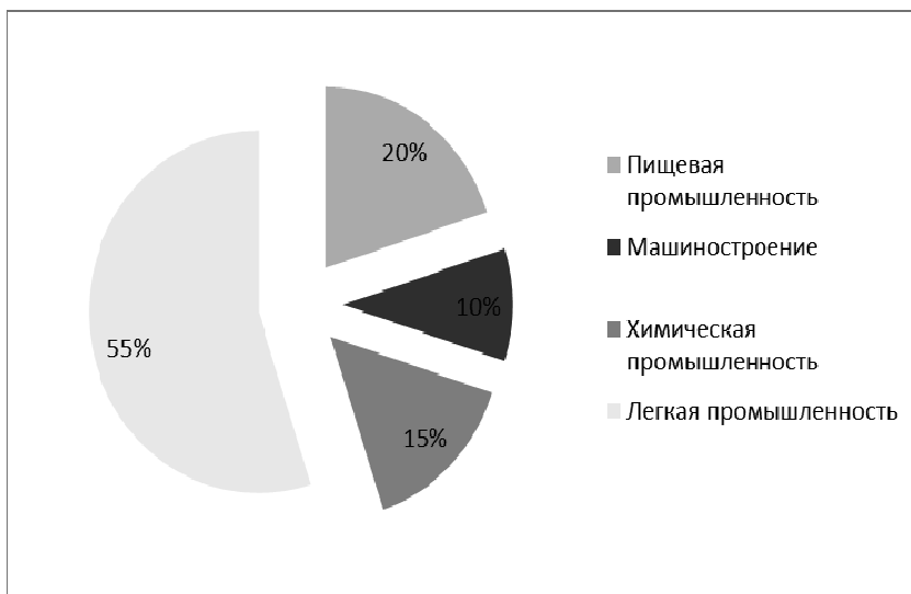
Рис. 1. Распределение средних городов по главной отрасли специализации (1897-1939 гг.).

Отличительной чертой данного этапа является смена источников энергии. Вначале 1960-х