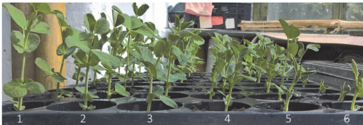
Рис. 1. Влияние синтетического аморфного диоксида кремния на растения гороха посевного сахарного (сорт Альфа, четырехнедельные проростки): 1-3 – предпосевная обработка семян аморфным кремнеземом 50 мг/г, 4-6 – контроль (без предпосевной обработки)