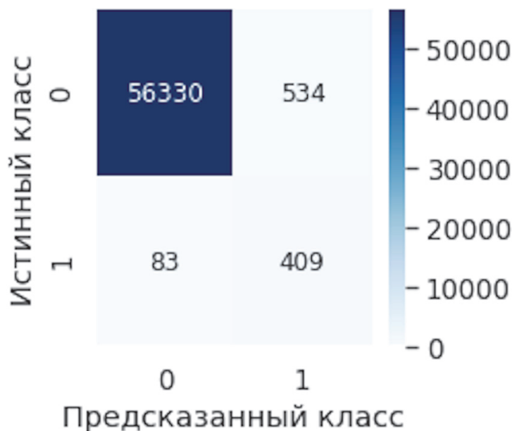
Рис. 3. Матрица ошибок классификации одноэтапным классификатором. 0 соответствует классу обычных, а 1 классу мошеннических транзакций