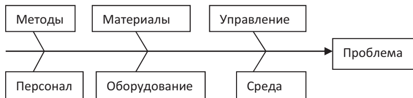
Рис. 2. Диаграмма Исикавы

При расчете приоритетного числа рисков с использованием метода Failure Mode и Effects Analysis (FMEA) вы умножаете значимость последствий несоответствия, оценивая вероятность возникновения несоответствия и оценивая возможность его обнаружения, не принимая во внимание тот факт, что несоответствия могут влиять друг на друга. То есть возникшее несоответствие может изменить как вероятность другого несоответствия, так и повысить трудность обнаружения другого несоответствия, а также изменить значимость последствий возникновения другого несоответствия.