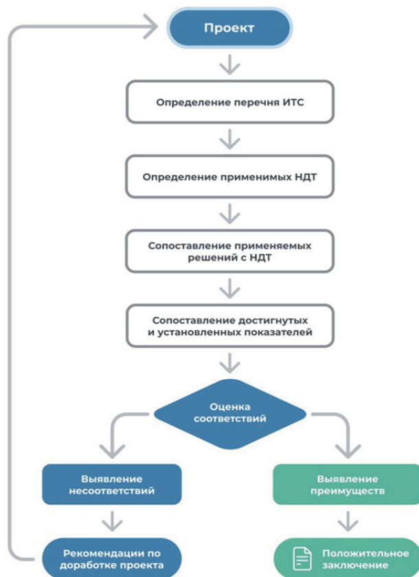
Рис. 1. Применение информационно-технических справочников по наилучшим доступным технологиям для экспертной оценки проектов эколого-технологической модернизации промышленности

Однако эксперты в сфере НДТ до последнего времени не привлекались к предварительной оценке инвестиционных проектов, в том числе проектов, претендующих на получение статуса зеленых. При этом потенциальная сфера применения экспертной оценки, то есть сфера, на которую авторы статьи предлагают такую оцен-