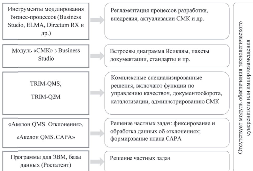
Рис. 3. Систематизация функционала программного обеспечения СМК (обобщено автором)

Таким образом, выявлена ограниченность автоматизированных систем менеджмента качества в контексте мониторинга и диагностики мероприятий в области импортозамещения и технологического суверенитета. Сформулирован вывод об ограниченном ассортименте комплексных программ решений в области менеджмента качества, обоснована необходимость и целесообразность развития существующих вариантов функционала программных продуктов поддержки СМК за счет включения модуля ОТС, позволяющего оценить вклад предприятия в наращивание технологического суверенитета страны.