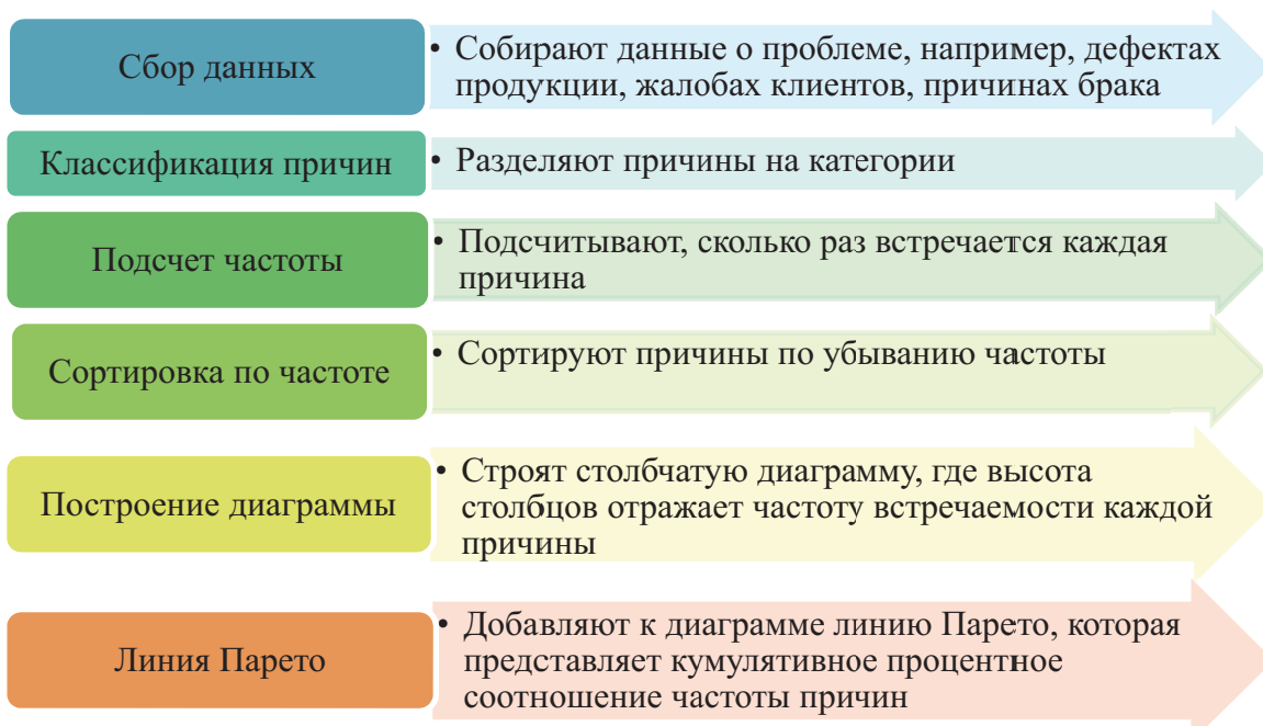
Рис. 1. Этапы работы диаграмма Парето