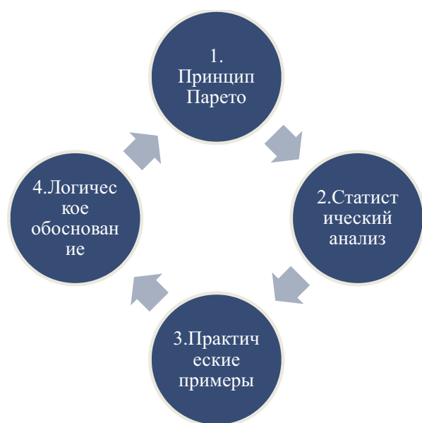
Рис. 4. Алгоритм обоснования использования диаграммы Парето

Предлагается алгоритм обоснования использования диаграммы Парето, рис. 4.