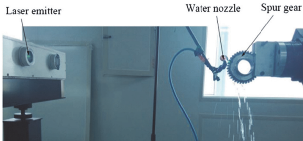
Рис. 1. Процесс ЛУО основания шейки зуба шестерни трансмиссии [12]