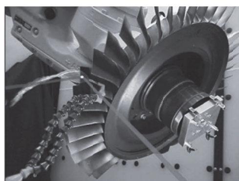
Рис. 3. ЛУО лопаток ротора двигателя

в области скругления корня зубьев преобладают остаточные напряжения сжатия величиной более 680 МПа на глубине почти в 4 раза больше, чем при традиционных методах обработки поверхности.