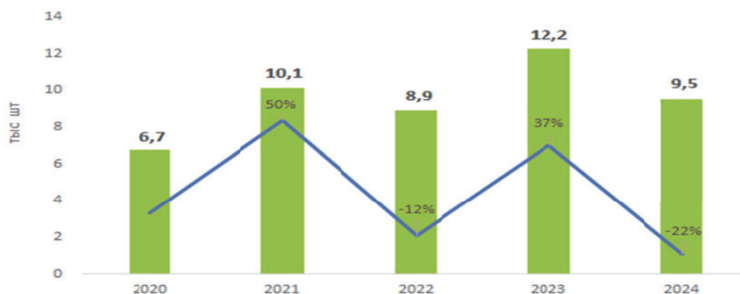
Рис. 1. Продажи оборудования для текстильной промышленности

должен в легкой промышленности обеспечивать конкурентоспособное качество не вопреки существующим системным проблемам, а для их преодоления и с учетом будущего отрасли.