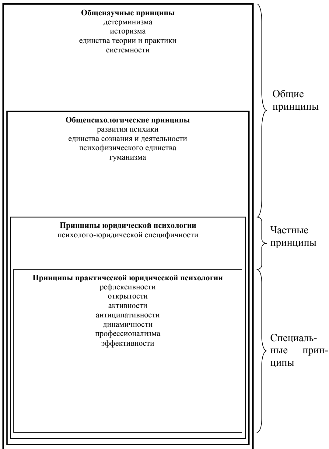
Схема 2. Иерархия отношений в системе принципов практической юридической психологии