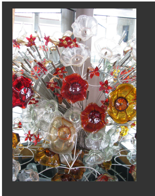
Рис.3. Декоративная композиция «Цветы музыкантам» (худож. В.Д. Герасимов) (Decorative composition "Flowers of the musicians" (art. V.D. Gerasimov))

Относительная строгость пластического языка фасадов нашла свое разрешение во внутреннем убранстве в монументально-декоративной аранжировке. С привлечением к работе художника В.Д. Герасимова здание наполнилось значительными объемно-пространственными произведениями монументального искусства. Два 14-метровых витража 2 фланкируют фойе слева и справа, словно демонстрируя органичность звучания музыкальной формы в градациях цветного стекла [8, с. 49 – 50]. Заданная вертикальность этих панно работает исключительно на внешнее восприятие. Автор как бы нарочито «обрушивает потоки» стеклянной массы на зрителя, с одной стороны – холодноватой тональности как отблесков северного сияния, с другой – солнечно-красных всполохов в мажорном исполнении.