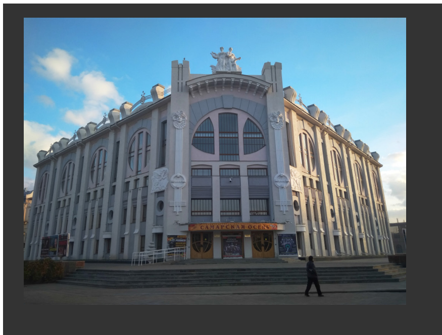
Рис. 1 Самарская государственная филармония (арх. Ю.В. Храмов) возведена в 1988 году на месте бывшего театра-цирка «Олимп» (арх. П.В. Шаманский) (Samara State Philharmonic (arch. Yu.V. Xramov) was erected in 1988 on the site of the former circus theatre "Olimp" (arch. P.V. Shamanskiy)

конструктивного решения, основанного на ассоциациях с предшествующим объектом. Современный архитектурный язык позволил в новой трактовке представить центральную часть главного фасада прежнего сооружения с трехчастным окном, скульптурой, декоративными рельефами, как проявление необходимой аутентичности деталей и композиций [4].