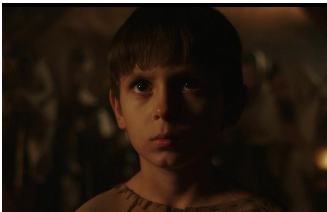
Фото 4. Голем в киноверсии 2018 г. (Golem in the 2018 film versions)

Голем в фильме 2018 г., в отличие от своих предшественников, ребенок, красивый мальчик с умным строгим взглядом (фото 4) – примерно того же возраста, что и погибший когда-то сын Ханны. Этим обусловлена глубокая духовная и душевная связь создательницы с ее творением, что тоже отличает данный сюжет от предыдущих киноверсий и мифа в целом. Она оберегает мальчика-Голема от непогоды, купает его, любовно шьет ему одежду, сажает за общий семейный стол, дарит игрушку покойного сына.