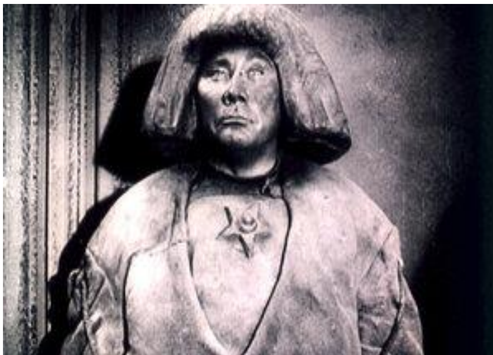
Фото 1. Голем в киноверсиях 1915, 1920 гг. (Golem in the film versions 1915, 1920)

В киноверсии 1936 г. Голем визуально более очеловечен и волос лишен совсем. Подчас напоминает если не лица самих диктаторов того