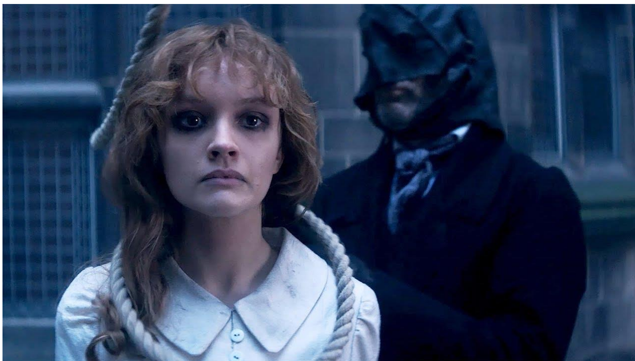
Фото 3. Голем в киноверсии 2016 г. (Golem in the 2016 film versions)

Все это вкуче, думается, и обеспечило фильму популярность у массового зрителя [25.] и награду в Невштале в номинации «Лучший европейский фантастический художественный фильм» (между тем, фантастическое начало в фильме сведено к нулю).