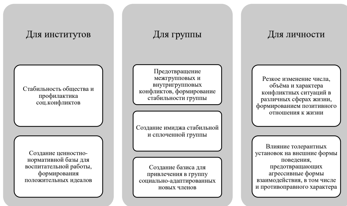
Рис. 1. Функции толерантности применительно к различным субъектам [10] (Functions of tolerance in relation to various subjects)

На указанные характеристики оказывают влияние преимущественно формы общественно-го сознания, одной из которых является религия, отражающая общественные отношения. Религиозное сознание является одним из наиболее стабильных социально-психологических массовых феноменов, который сыграл большую роль в становлении и развитии человечества. Это, в частности, обусловлено тем, что каждая из религий определяет набор ценностей и установок, передаваемых из поколения в поколение, оказывающих влияние на формирование общества, а точнее, общественных групп, оказывая влияние на жизнь личности в духовном, эмоциональном и волевом плане. Одна из наиболее важных функций религии заключается, по мнению К.Г. Юнга и Э. Фромма, в формировании мировоззрения человека, в том числе и установление смысла жизни. Как считают ученые, личность, у которой утрачено понимание смысла происходящего, становится беспомощной и слабой. Т.е. религия дает возможность человеку на мировоззренческом уровне разрешать противоречия реального мира, достойно преодолевать жизненные невзгоды, страдания и даже смерть, т.к. для религиозного человека они исполнены глубоким смыслом.