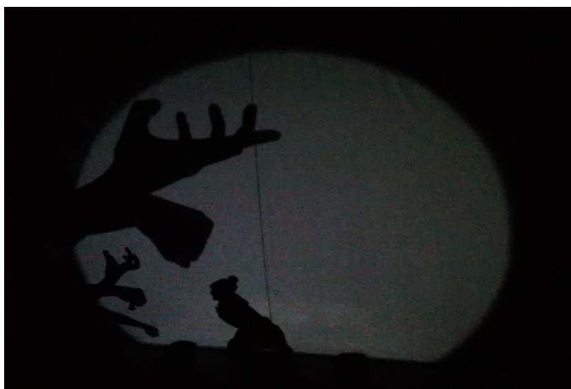
Рис. 2. Из спектакля «Рождественское сновидение», актёрский курс театра кукол Н.П. Наумова, режиссёр-педагог А. Вученович, РГИСИ, 2018 (From the play "Christmas Dream", the acting course of the puppet theater N.P. Naumova, director-teacher A. Vuchenovich, RGISI, 2018)

В отличие от активного, пассивное воображение , возникает без волевых усилий и без сознательных намерений человека. Чаще всего это относится к сновидениям, которые играют важную роль в театральном воображении, особенно это касается кукольного театра (рис. 2). В кукольных спектаклях персонажи, как и во сне, могут летать, падать и затем подниматься, как будто ничего не произошло, внезапно появляться и таинственным образом исчезать. Сновидения напрямую связаны с творческим актом. Есть много примеров, когда художники, композиторы, писатели создавали свои произведения на основании увиденного во сне. Вопросы, связанные со сновидениями, всегда интересовали человека.