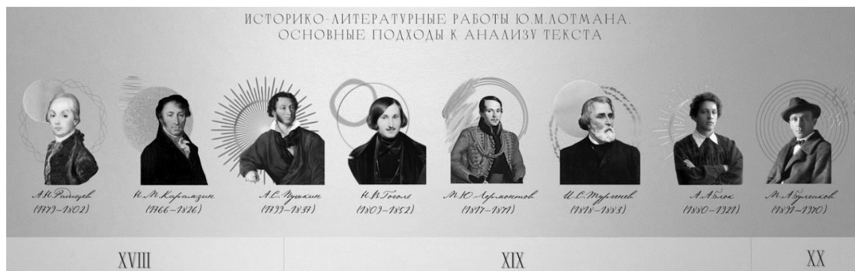
Рис. 1. Лента времени «Историко-литературные работы Ю.М. Лотмана. Основные подходы к анализу текста» (Timeline «Historical and Literary Works of Yu.M. Lotman. Basic Approaches to Text Analysis»)

Второй и третий диалоги явились необходимыми этапами в подготовке к осмыслению семиосферы Ю.М. Лотмана. Во время второго диалога