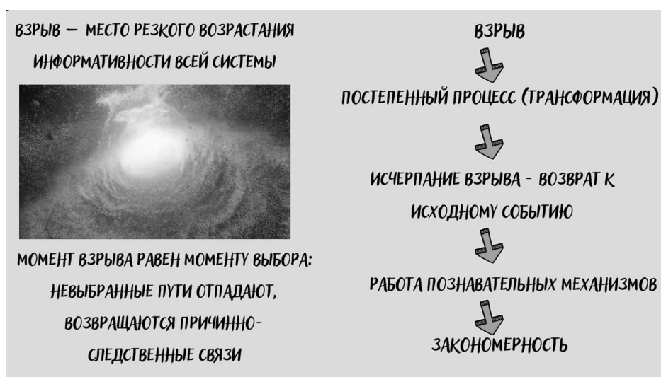
Рис. 2. Инфографика по работе Ю.М. Лотмана «Культура и взрыв» (Infographics on the Yu.M. Lotman's «Culture and Explosion»)

Представить проект команда СГСПУ решила в виде учебного фильма. Это динамическая презентация основных работ ученого, посвященных