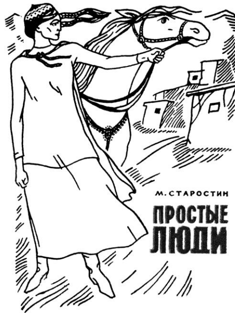
Рис. 6. Обложка книги М. Старостина «Простые люди» (Cover of the book by M. Starostin "Ordinary People")

Несмотря на свое увлечение графикой, окончив академическую школу живописи, Анатолий Георгиевич никогда не расставался с красками. Именно по этой причине среди его работ много портретов и сюжетных композиций. В работах художника наблюдается явный отход от академической светотеневой трактовки формы, романтический колорит создает основу образа. В более поздний период творчества можно заметить стремление найти компромисс в изображении современника при явном отказе от нарочитого позирования перед зрителем. Каждый его герой спокоен, задумчив и самодостаточен. Композиции А.Г. Песигина в определенной степени крупноплановы и фрагментарны, художник уделяет внимание лицу, фон условный. Тенденции к определенному обобщению и некой стилизации формы свойственны многим работам периода «семидесятников».