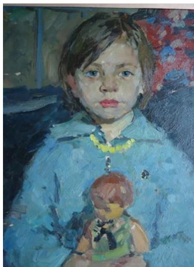
Рис. 1. Девочка с куклой. Картон, масло (Girl with a doll. Cardboard, oil)

Поездка в Ленинград и знакомство с мастерством художников модернизма явилась знаковой для Анатолия Георгиевича. «Портрет Анны Ахматовой Альтмана – вещь прекрасная! Это для меня!» (из дневника А. Песигина – Е.М.) – так он пишет в своем дневнике. Поиску своего языка посвящена вся творческая деятельность. Время 60-70-х гг. не отличалось роскошью в советской стране. Жили экономно. Многие работы выполнены на старых афишах, и иногда в качестве основы использована упаковочная бумага или картон коробок. Приходилось выбирать для творчества оптимальные средства. Тушь и карандаш не требовали больших затрат. Возможно, отчасти в процессе поиска нового языка и желания работать цветом родилась идея работы по бумаге масляными красками тонким слоем, втирая губ-