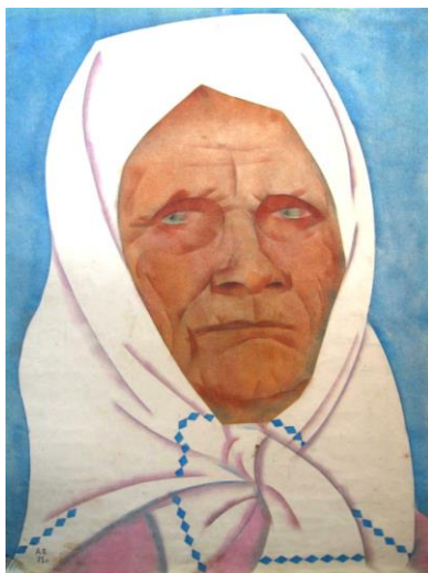
Рис. 2. Портрет матери. Бумага, масло (Portrait of mother. Paper, oil)

Женщина, пережившая лишения и горести Великой Отечественной войны, олицетворяет собой целое поколение людей второй половины XX в., на долю которых выпало много потрясений. Потерявшая на фронте мужа, нашедшая в себе силы и энергию жить дальше, не боится ничего и готова к любым трудностям.