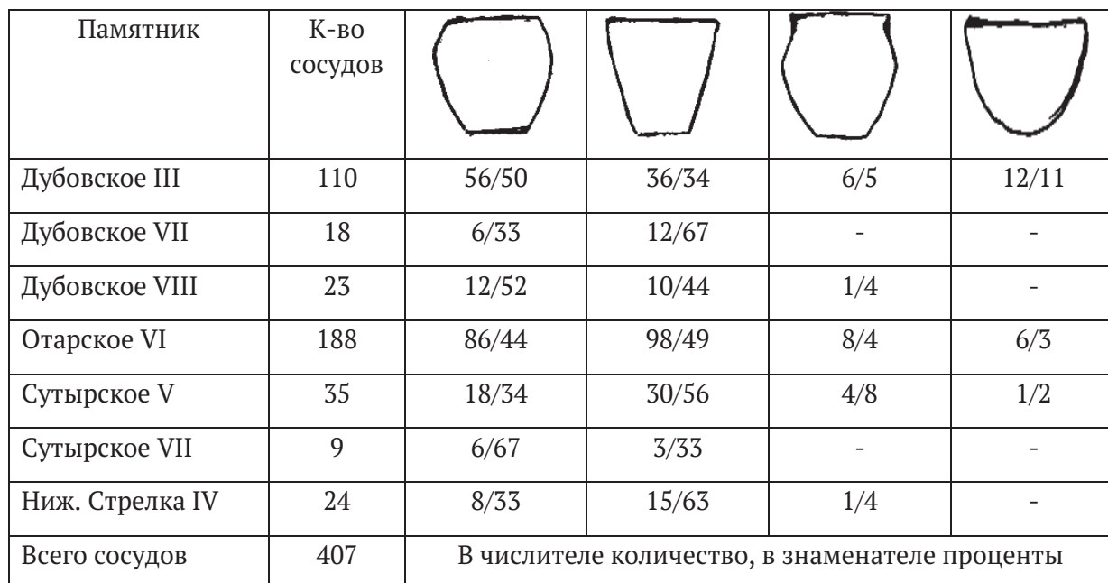
Таблица количественного соотношения форм сосудов раннего периода

– 100% и 77% 2 . Практически вся посуда (за исключением чаш) плоскодонная или плосковогнутая. Конических днищ нет. Выделяется две группы посуды: 1 – с орнаментом, 2 – без орнамента. Судя по обломкам верхней части и днищ орнамент присутствует на 52-53% посуды, колеблясь в незначительном интервале в одну или другую сторону. Построение орнамента горизонтальное, в верхней и нижней трети сосуда. Редко орнамент покрывает всю внешнюю (включая и дно) поверхность. Самый распространенный элемент орнамента - треугольная ямка, поставленная отдельно или в непрерывную строчку. На Дубовском III в таком стиле украшено 81 % сосудов. Близкая картина и на остальных памятниках. Кроме треугольного накола в орнаментике встречаются насечки (короткие и длинные, ногтевидные), круглые и овальные вдавления. Композиции простые и состоят из рядов (горизонтальные, диагональные), косой сетки, вертикальных и горизонтальных зигзагов, заполненных горизонтальных поясов. Более сложные узоры наносились на днище: круги, сетка в круге, расходящиеся лучи, ромб с перекрестием, елочка со стеблем и пр. 3 По крупным частям реконструировано 82 сосуда: горшки – 31, банки – 40, чаши – 11. Установленные