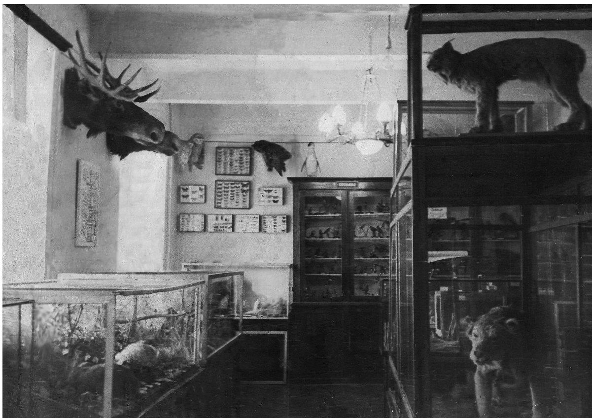
1971 г. Большой зал старого зоо музея, на ул. М. Горького. Видны диорамы, выполненные таксидермистом Н.Л. Белоноговым

ственной подготовки грамотных биологов, к 1960-м годам она не уступала в этом отношении учебным занятиям в университетах. На лекциях стали появляться новые технические средства - эпидиаскопы, кинокамеры и кинопроекторы и др.