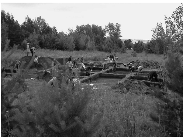
Рис. 1. Вид площадки Зуевключевского I городища с западной стороны. Раскопки в северо-восточной части городища (2005 г.)

В то же время многие археологические памятники, расположенные под открытым небом в естественном окружении ландшафта, среди которого они возникли, имеют огромный познавательный интерес и обладают большой силой эмоционального воздействия.