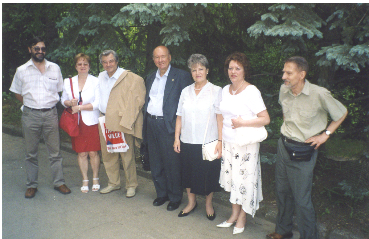
Участники выездного заседания Бюро Отделения биологических наук РАН (9-11 июня 2005 г.)