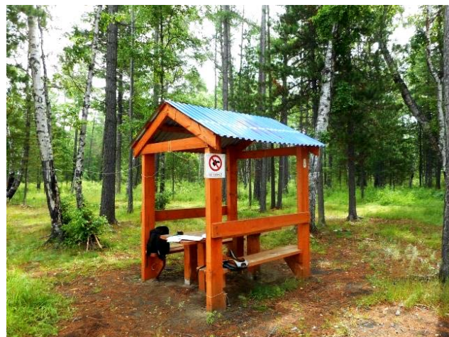
Рис. 5. Организованное кострище на территории (фото слева); Беседка с металлопрофильным покрытием (фото справа).