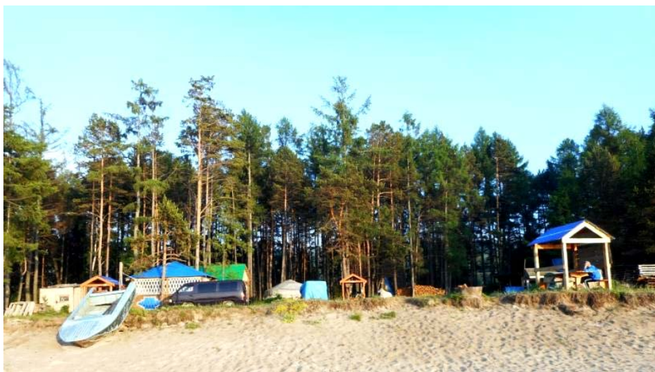
Рис. 3. Территория администрации ГУ «Бурприрода»

Администрация предоставляет следующие услуги отдыхающим: Баня – 1000 руб./час; Охалка дров – 150 руб.