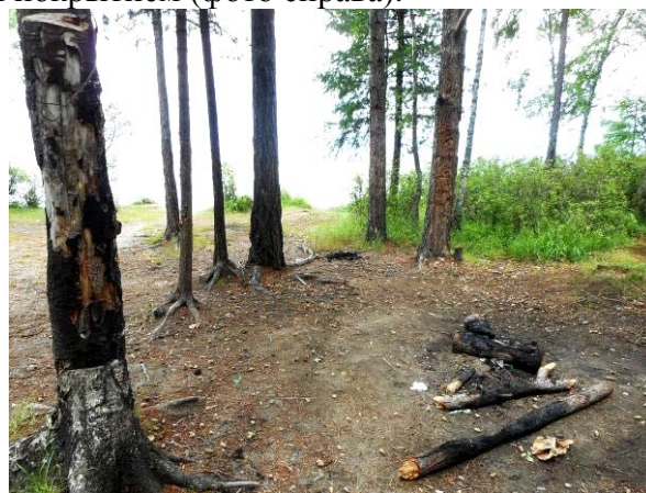
Рис. 6. Самодельный умывальник из пластиковых бутылок на стволе дерева (фото слева); Неорганизованное кострище и следы оборванной коры с березы (фото справа).