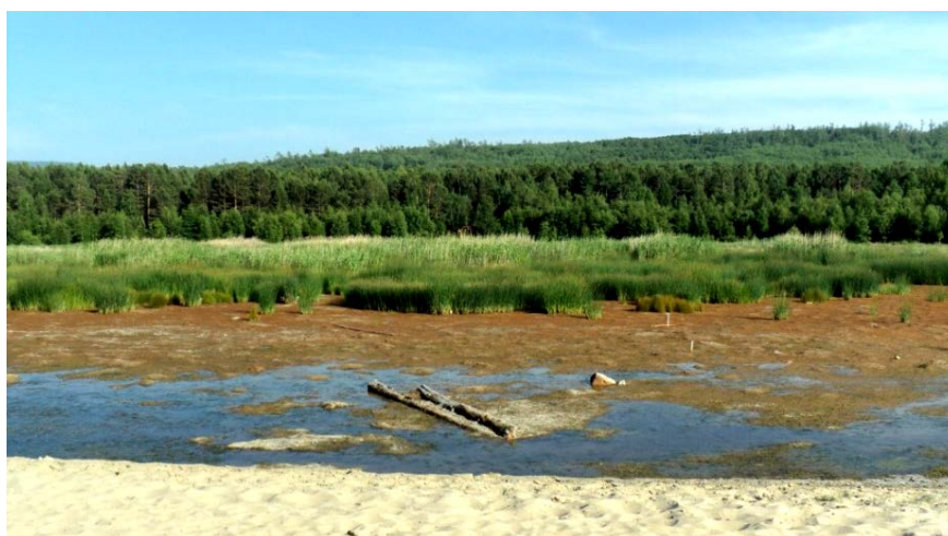
Рис. 2. Калтус в окрестностях термального источника «Загза» на территории рекреационной местности «Побережье Байкала»

Гидросеть рекреационной местности развита слабо. Единственные крупные реки – Энхалук и Загза. В среднем течении р. Загза имеет ширину от 1,5 м до 2,5-3 м. Цвет воды прозрачный с мутным оттенком. Также в данной местности встречаются калтуса (рис. 2) – обширные болота.