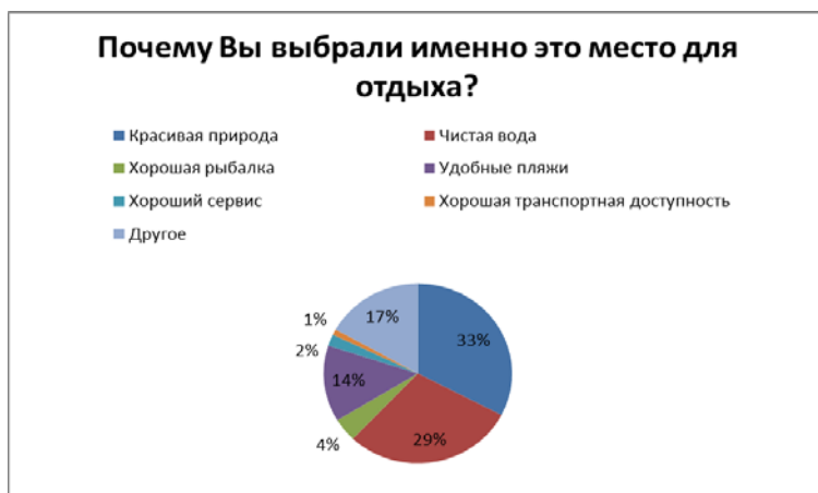
Рис. 8. Соотношение ответов опрошенных на вопрос «Почему Вы выбрали именно это место для отдыха?».

чистых пляжей, 2% ответили, что причиной является хороший сервис, и лишь 1% – хорошая транспортная доступность. Также отмечены другие причины для отдыха – наличие базы «Загза» с термальным источником для лечебных целей (рис. 8).