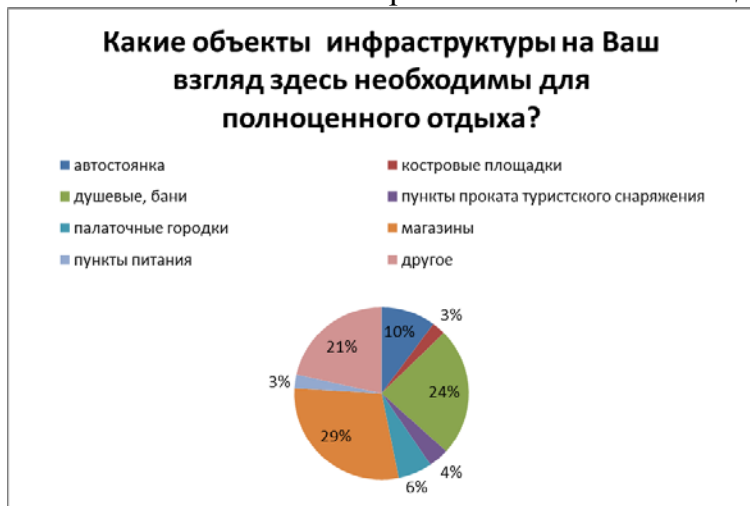
Рис. 9. Соотношение ответов опрошенных на вопрос «Какие объекты инфраструктуры на Ваш взгляд здесь необходимы для полноценного отдыха?».

чистых пляжей, 2% ответили, что причиной является хороший сервис, и лишь 1% – хорошая транспортная доступность. Также отмечены другие причины для отдыха – наличие базы «Загза» с термальным источником для лечебных целей (рис. 8).