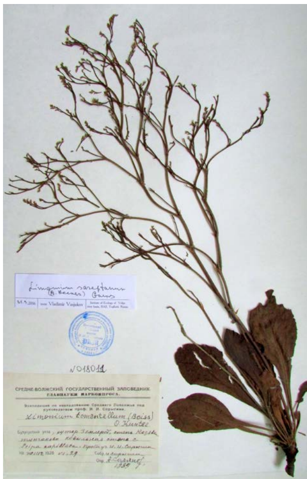
Рис. 2. Гербарий Stalice (Limonium sareptanum (A. Becker) Gams) , собранный экспедицией на участке «Козьявка», хранящийся в гербарии Пензенского государственного университета (РКМ)

Местами присутствует большая площадь с господством St. dasyphyllus , виденная нами в южной части центральной большой целины у Киреевой дороги и в юго-западном целинном участке также в южной его части у дороги из Землероба.