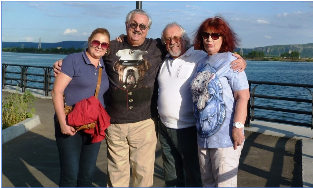
Тольятти, набережная Куйбышевского водохранилища, 23 июля 2013 г. Дружим семьями.