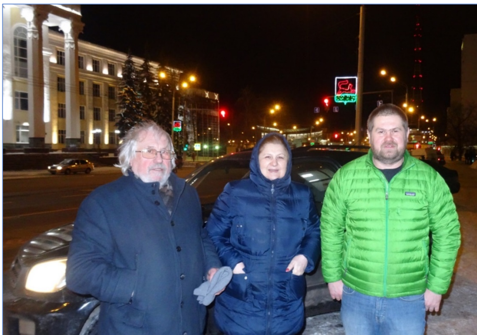
Уфа, ул. Заки Валиди (бывшая – Фрунзе), Башгосуниверситет, 24 октября 2019 г. Семейство

священа легендарному И.Д. Папанину (кстати, основателю Куйбышевской биостанции, превратившейся