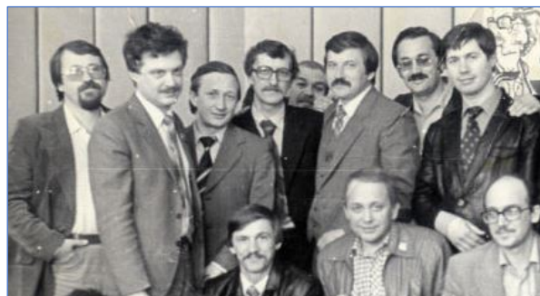
и одиннадцать лет спустя... (Уфа, 1983)