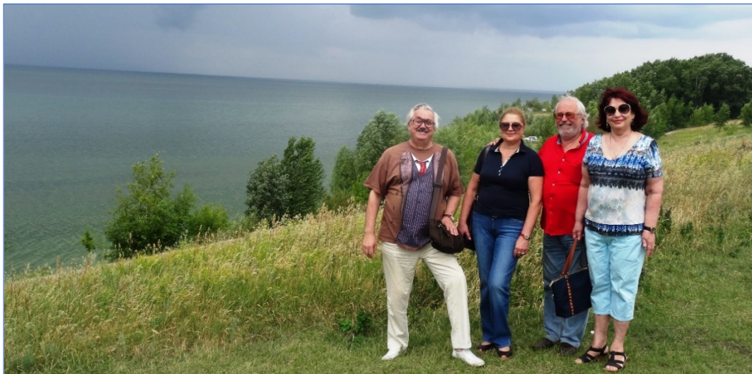
Село Хрящевка, Куйбышевское водохранилище, 11 июля, 2015 г.