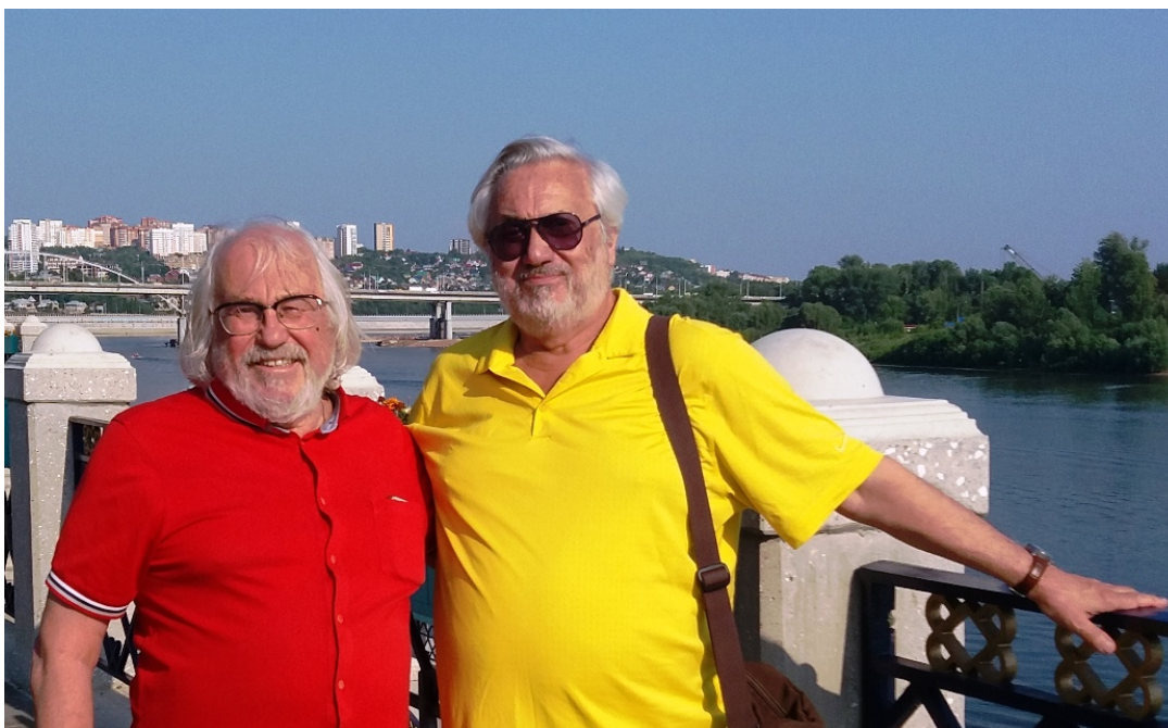
Уфа, набережная р. Белой. 8 июля 2020 г.