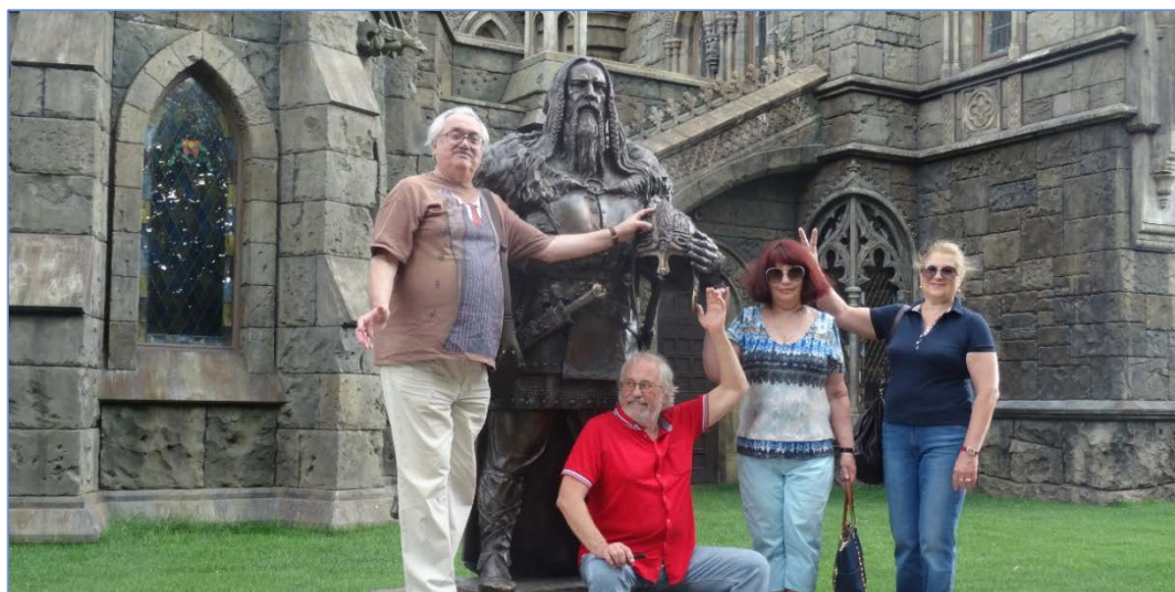
Село Хрящевка, Замок Гарibaldi, 11 июля, 2015 г.